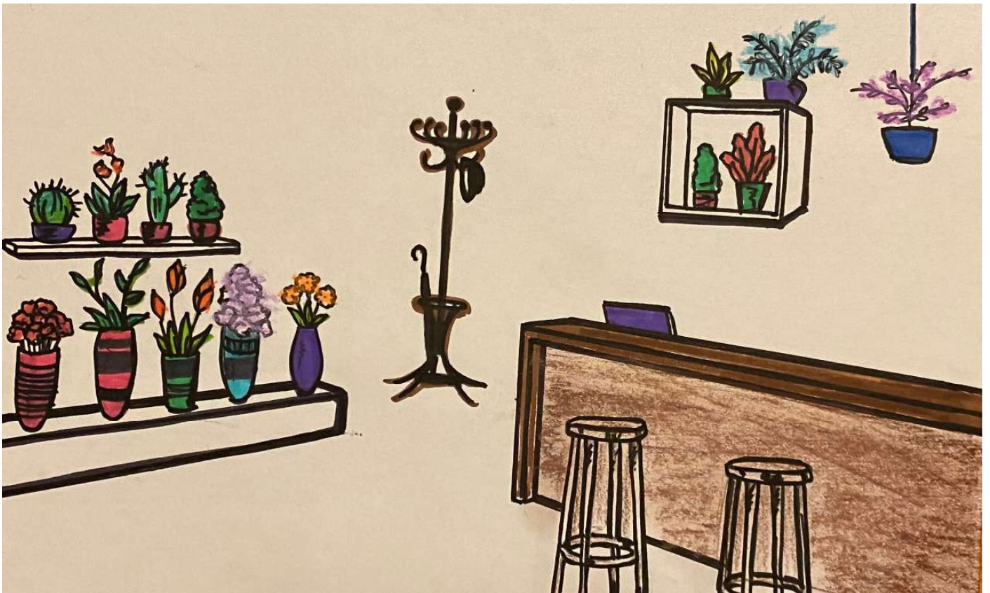
Dessin décor - Selin Dogan