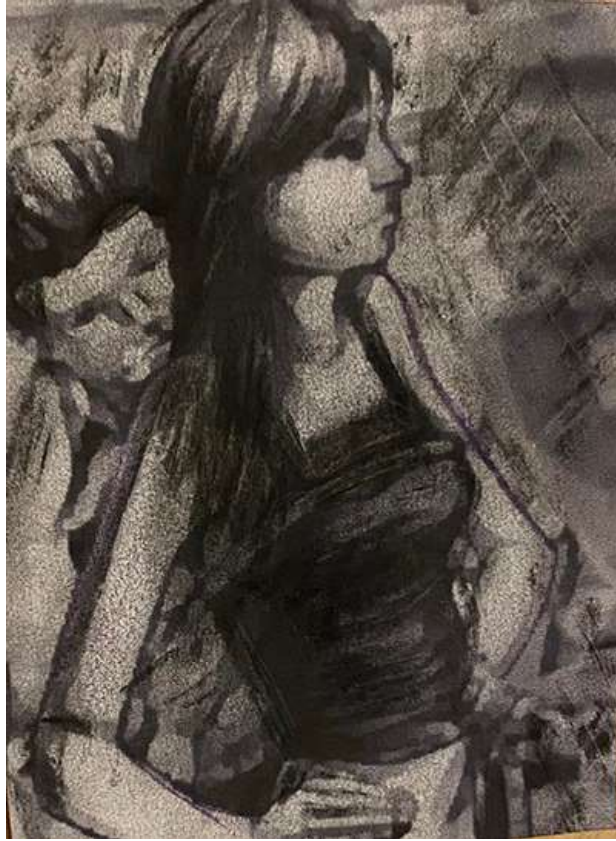
Dessin Pourquoi t'es restée ? - Selin Dogan